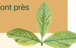
Figure 4. Chloroses internervaires associées à une carence en magnésium

Guide de référence en fertilisation, CRAAQ ▶▶▶