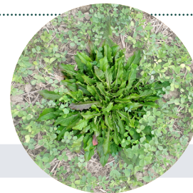
Figure 1. Pissenlit dans une prairie de 2 e année