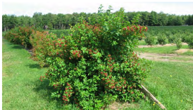
Figure 8. Haie d'arbustes à fleurs à proximité des champs de bleuets

Pour les abeilles sociales, comme les bourdons, la période de vol est beaucoup plus longue. Elles sont souvent les premières abeilles actives au printemps et les dernières en automne. De ce fait, les plantes à floraison hâtive, comme le saule, et à floraison tardive, comme la verge d'or, sont particulièrement importantes pour la survie de ces abeilles.