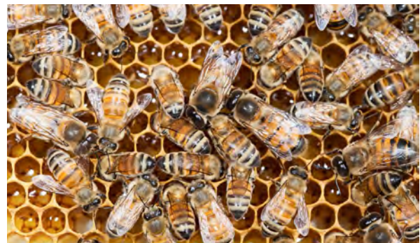
Figure 2. Colonie d'abeilles domestiques