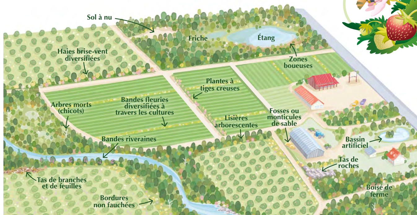
Figure 12. Synthèse des aménagements et des installations favorisant la présence des pollinisateurs. (Illustration : Lorraine Beaudoin, © 2022)