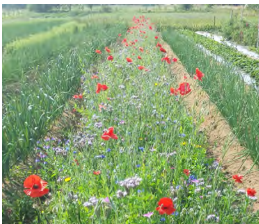
Figure 10. Bande fleurie dans une parcelle maraîchère

Entretien : Ces aménagements nécessitent des travaux d'entretien assez importants, et ce, surtout dans les premières années (fauchage en bordure des plantations durant les premières années, rabattage de certains arbustes, désherbage). Dans le cas de la plantation d'arbres et d'arbustes, des travaux de taille de formation et d'élagage sont à prévoir sur une plus longue période. Dans le cas des bandes fleuries, la préparation du terrain préalable est une étape critique et doit être faite de façon très rigoureuse afin d'éviter la compétition herbacée.