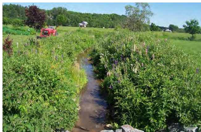
Figure 5. Bande riveraine avec diverses plantes herbacées à fleurs

Une observation du site permettra de vérifier si ce dernier est bien utilisé par des pollinisateurs.