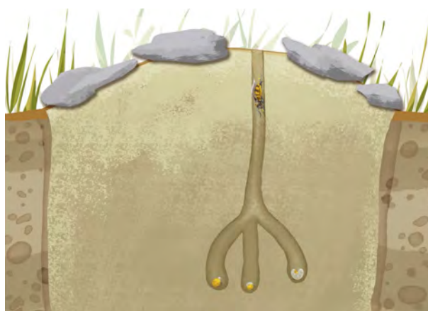
Figure 11. Parcelle de nidification pour abeilles nicheuses de sol. (Illustration : Lorraine Beaudoin, © 2022)

L'implantation peut être conçue de deux façons :