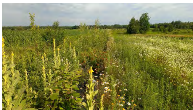
Figure 7. Haie d'arbustes à fleurs, engrais vert de sarrasin, fleurs herbacées naturelles, à proximité des champs de bleuets

Les nouveaux aménagements doivent idéalement respecter certains critères :