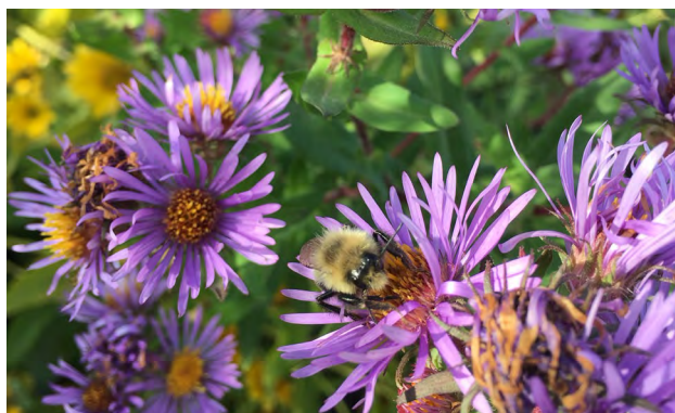
Figure 9. Plantes à fleurs herbacées de la famille des astéracées