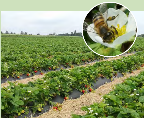
Figure 3. Champ de fraise et abeille (Crédits: William Laforge, Fertior)

(Source: Ministère de l'Environnement, de la Lutte contre les changements climatiques, de la Faune et des Parcs)