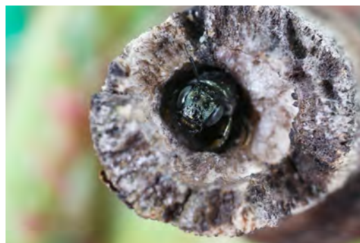
Figure 4. Petite abeille charpentière à l'intérieur d'une tige

70 % des abeilles solitaires font leur nid dans le sol ( J. Moisan-De Serres et al. 2014 ), alors que certaines utilisent d'autres substrats: par exemple, elles vont creuser des tunnels dans du bois mort, des tiges de bois creux, des roseaux, des ronces ou nicher dans des fissures de rochers.