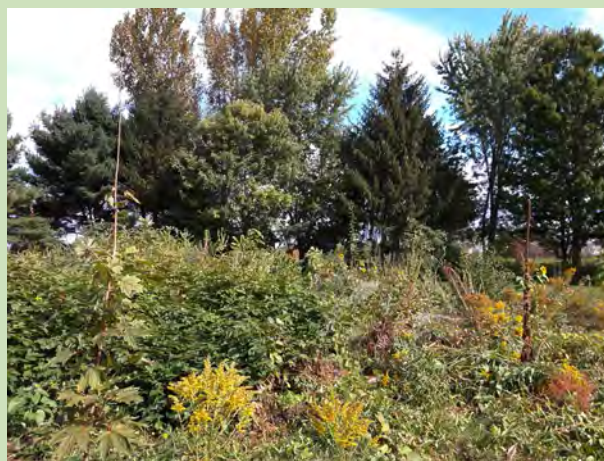
Figure 6. Friche diversifiée

Il est suggéré de conserver en habitat non perturbé, l'équivalent de 20 % de la superficie cultivée pour améliorer les rendements des cultures à la ferme. (J. Moisan-De Serres et al. 2014) Ce pourcentage peut varier en fonction des cultures, dont les besoins sont différents.